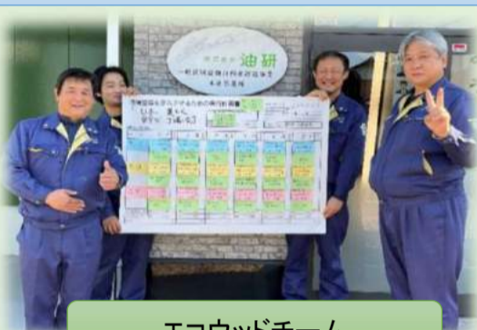
エコウッドチーム