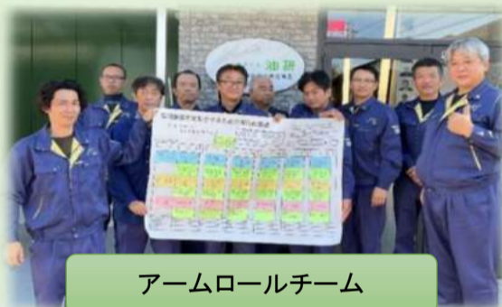
アームロールチーム