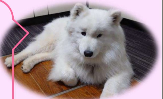
ゆ けん 癒。犬