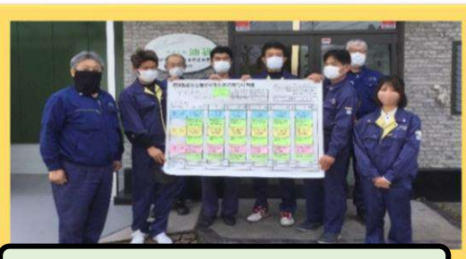
アームロールチーム (10名)

環境整備アセスメントもコロナ禍となってから3回目の開催となりました。今回も引き続き会社全体で集まらず、事前に各グループで作成した実行計画書を、グループ毎に時間を分けて発表・承認を行いました。アセスメント後に行っていました、「All Free Party」は開催を自粛しています。