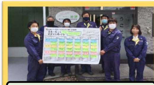
エコウッドパークチーム (6名)