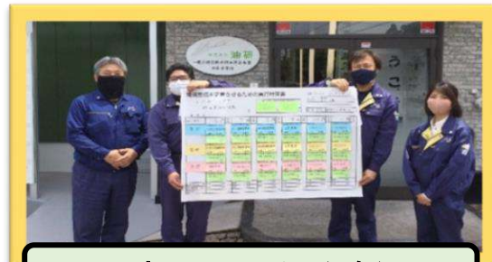
コウサンチーム (3名)