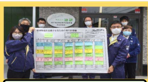
Newサポートチーム (7名)