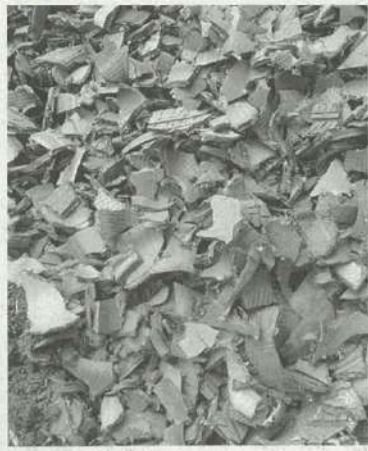
利用先を探すタイヤチップ

日本製鉄広畑製鉄所を終了する。14年から（兵庫姫路市）の及行ってきた製鉄事業競争力の強化を図った施設は、年間約6万tと国内でも多くの廃タイヤを処理してきた重営の効率化」が掲げられていた。（関連記事1面）