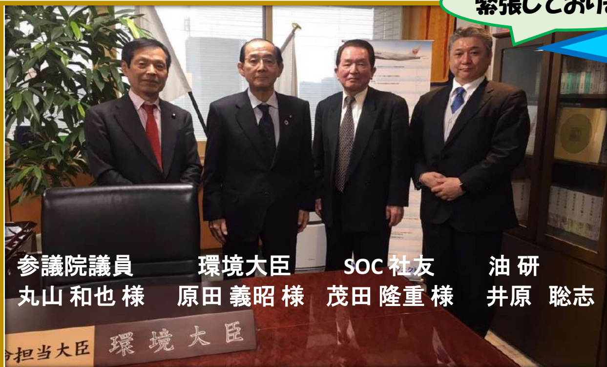
参議院議員 環境大臣 SOC 社友 油研 丸山和也様 原田義昭様 茂田隆重様 井原 聡志

2019年2月22日(金)に 内閣府 中央合同庁舎 環境省大臣執務室 にて 打ち合わせをさせていただきました!