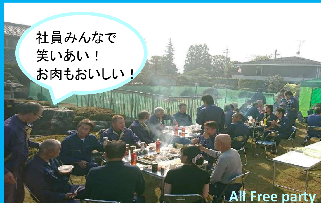
All Free party

環境整備アセスメント終了後に、社員全員で「お肉パーティー (All Free party)」が開催されました。